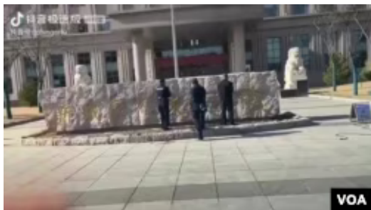
内蒙古呼和浩特市新城区人民检察院铲除门前石雕上的蒙古文字

恩赫巴图举例说，从2020年开始，中国中央政府在内蒙古强行推行所谓的“第二代双语教育”。这听起来好像提倡学习蒙汉两种语言，但实际上是禁止蒙古族学生接受蒙语授课，推行彻底汉化，剥夺蒙古人的基本人权，大搞文化上的种族灭绝。这次新一轮的“双语教育”遇到了广大蒙古人民的强烈抵制，连汉族干部群众都感到不理解。