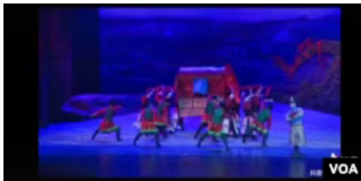
中共当局让演员穿蒙古族服装跳东北大秧歌

中共当局还在各种文艺演出和晚会上极力删减具有蒙古族特点的节目，有的改成不伦不类的东西，如，穿蒙古族服装唱京剧、扭秧歌等。在内蒙古地区大受欢迎的蒙古国艺人和某些节目、歌曲被点名限制入境和出演。